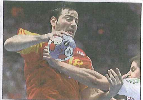
EXCELENTE. En la segunda parte Romero fue el estilete español.